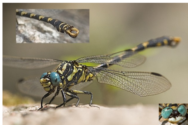
Onychogomphus uncutus . Mascle.

Mida més petita (46-50 mm). Ulls molt separats. Apèndixs abdominals dels mascles en forma de pinça. No són tan foscos. Acostumen a aturar-se sobre les roques que emergeixen de l'aigua.