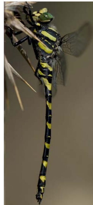
Masclle de perfil.