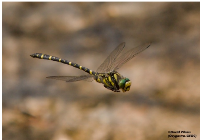
Masclle volant.