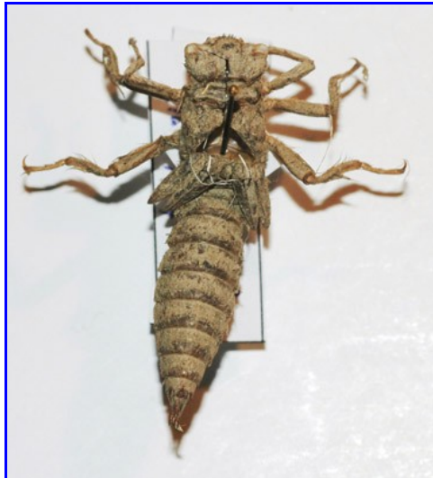
1. Exúvia de Cordulegaster boltonii en visió dorsal.

La forma de l'exúvia la fa inconfusible (1), però ens podrem assegurar mirant el cap frontalment i observant la forma de les dents dels palps labials (2). La màscara té forma de cullera. Els segments abdominals 8 i 9 presenten espines laterals .